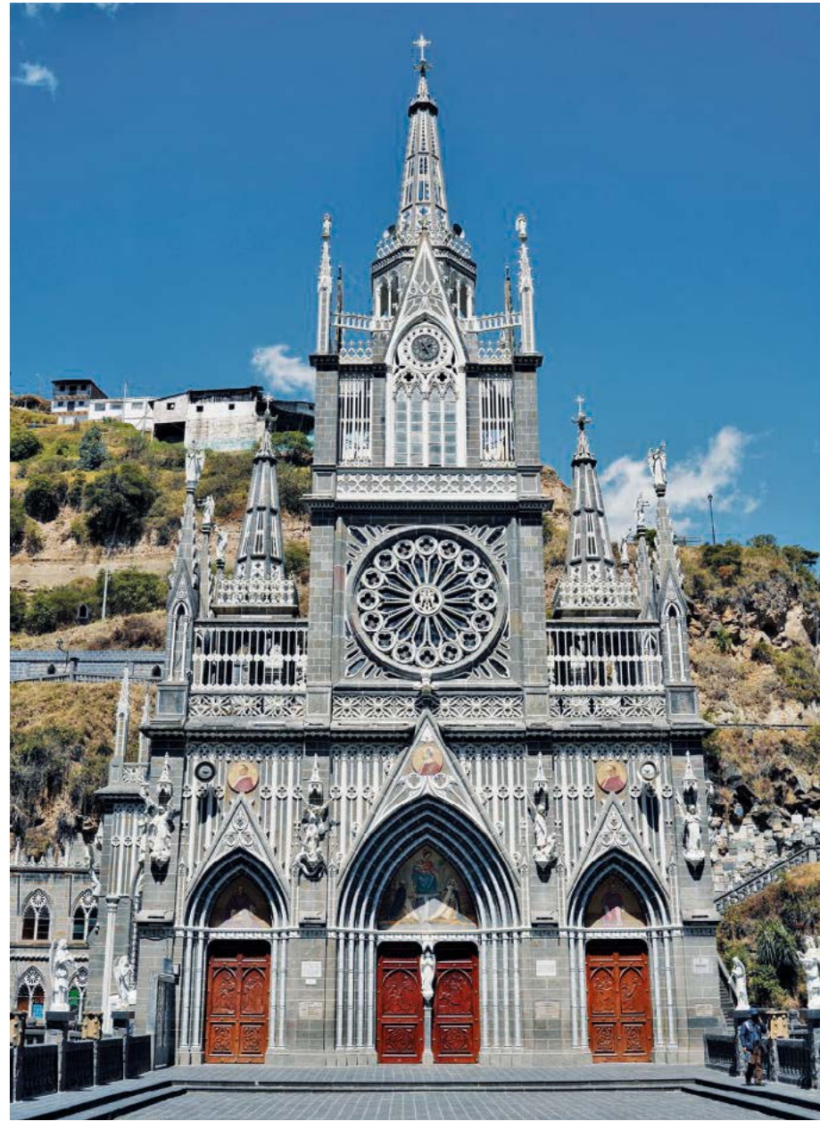
撰文 雷恩波·尼尔森 (Rainbow Nelson) | 摄影 皮娅·里维罗拉 (Pia Riverola)